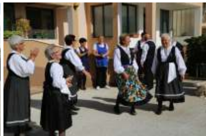
Dům pro seniory Giovanni ve Vrssi