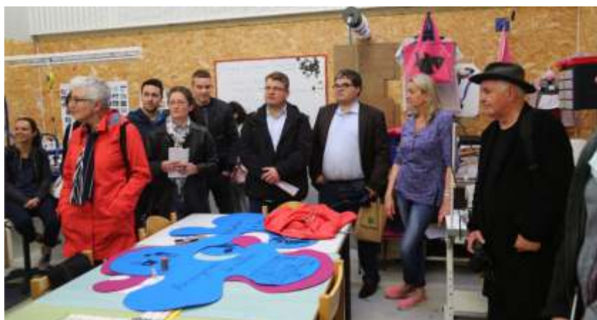
Dílny v Les Mauriers