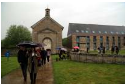
Návštěva v Les Mauriers - chráněné dílny