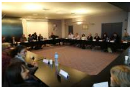
Oficiální zahájení návštěvy na radnici ve městě Plaintel